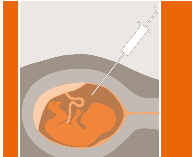
Schematische Darstellung einer Fruchtwasserpunktion.

nur möglich, wenn eine betroffene Familie einschließlich des kranken Familienmitgliedes entsprechend voruntersucht wurde. Zusätzlich zur Chromosomenanalyse wird aus Fruchtwasser ein Eiweißstoff, das Alphafetoprotein (AFP) bestimmt. Erhöhte Werte können auf eine Wirbelsäulenverschlusstörung hindeuten. Kleinere Defekte oder gedeckte Spaltbildungen werden jedoch nicht sicher erfasst.